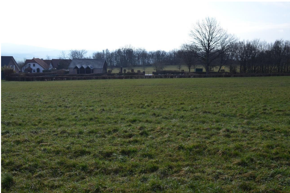
Abbildung 3: Plangebiet Blickrichtung Westen Süden (Friedhof), Eigene Aufnahme vom 07.03.2023