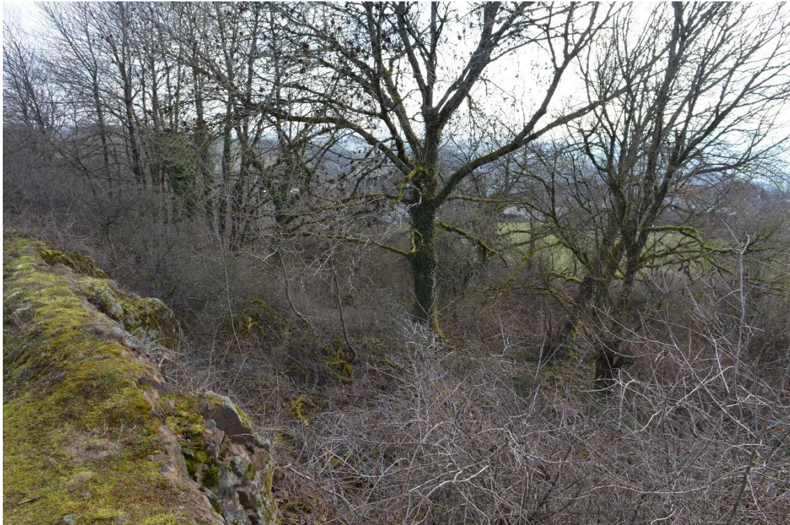
Abbildung 4: Nördlicher Rand Plangebiet (Blickrichtung Süden), Eigene Aufnahme vom 07.03.2023