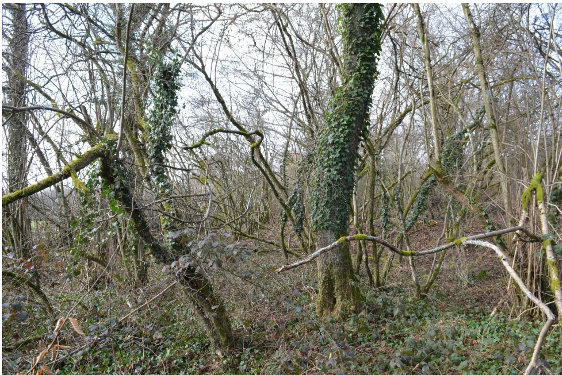
Abbildung 5: Wallhecke mit Überhältern älterer Ausprägung, Eigene Aufnahme vom 07.03.2023