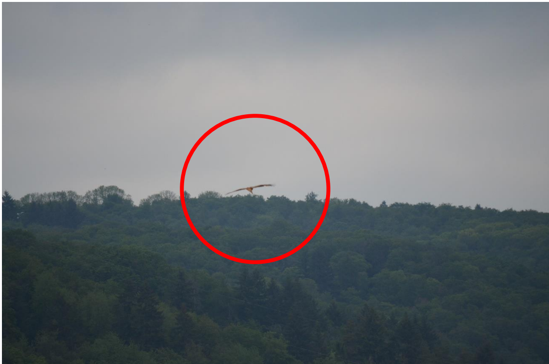
Abbildung 10: Rotmilan nahrungssuchend, Suchflug nach Norden Eigene Aufnahme vom 25.03.2023