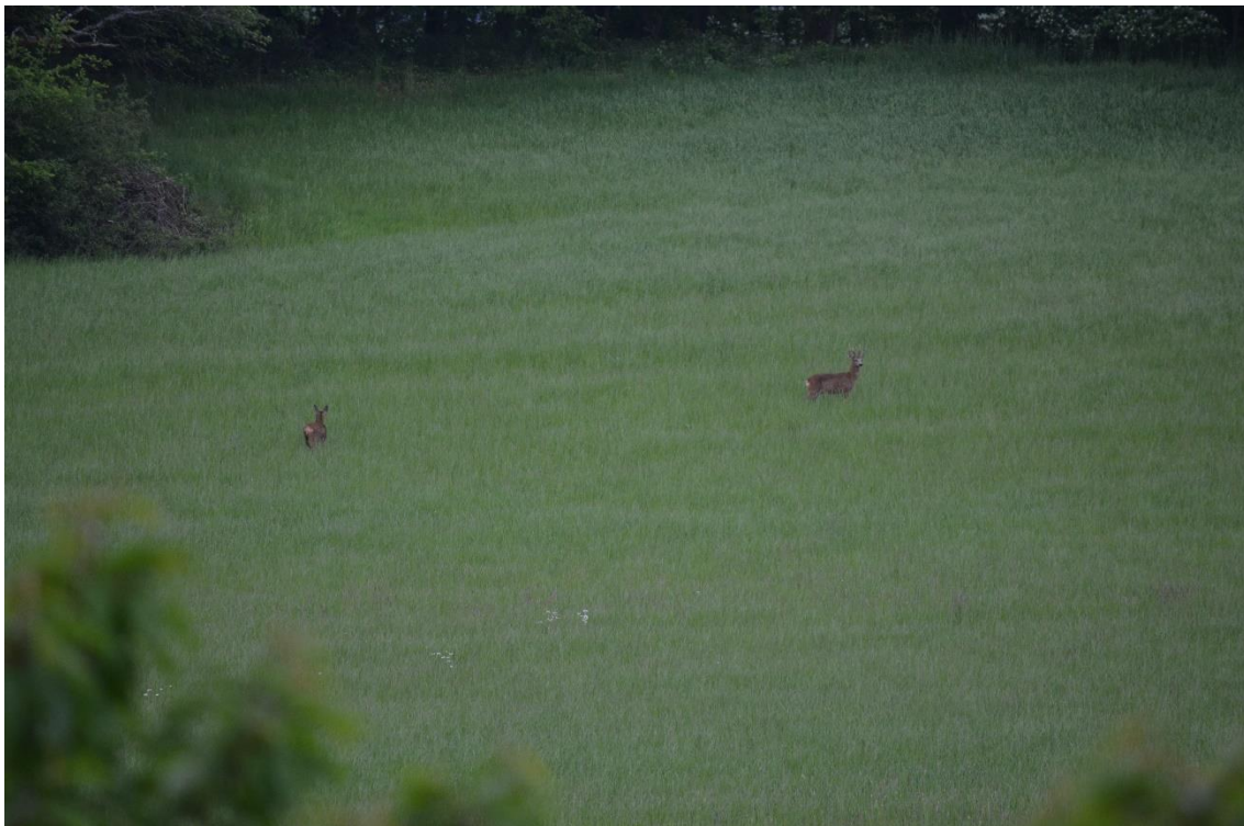
Abbildung 11: Rehe, bei der Kartierung aus der Gehölzgruppe aufgescheucht Eigene Aufnahme vom 25.03.2023