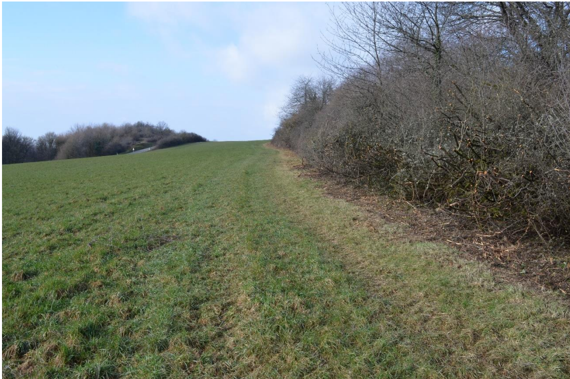
Abbildung 2: Gehölzstrukturen Plangebiet (Blickrichtung Westen), Eigene Aufnahme vom 07.03.2023