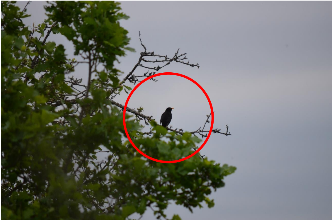
Abbildung 8: Amsel ♂ auf Sitzwarte Eigene Aufnahme vom 25.03.2023