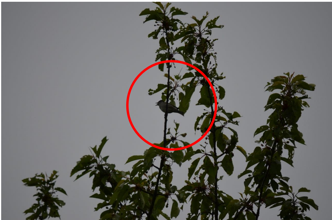
Abbildung 9: Mönchsgrasmücke ♂ auf Sitzwarte, singend