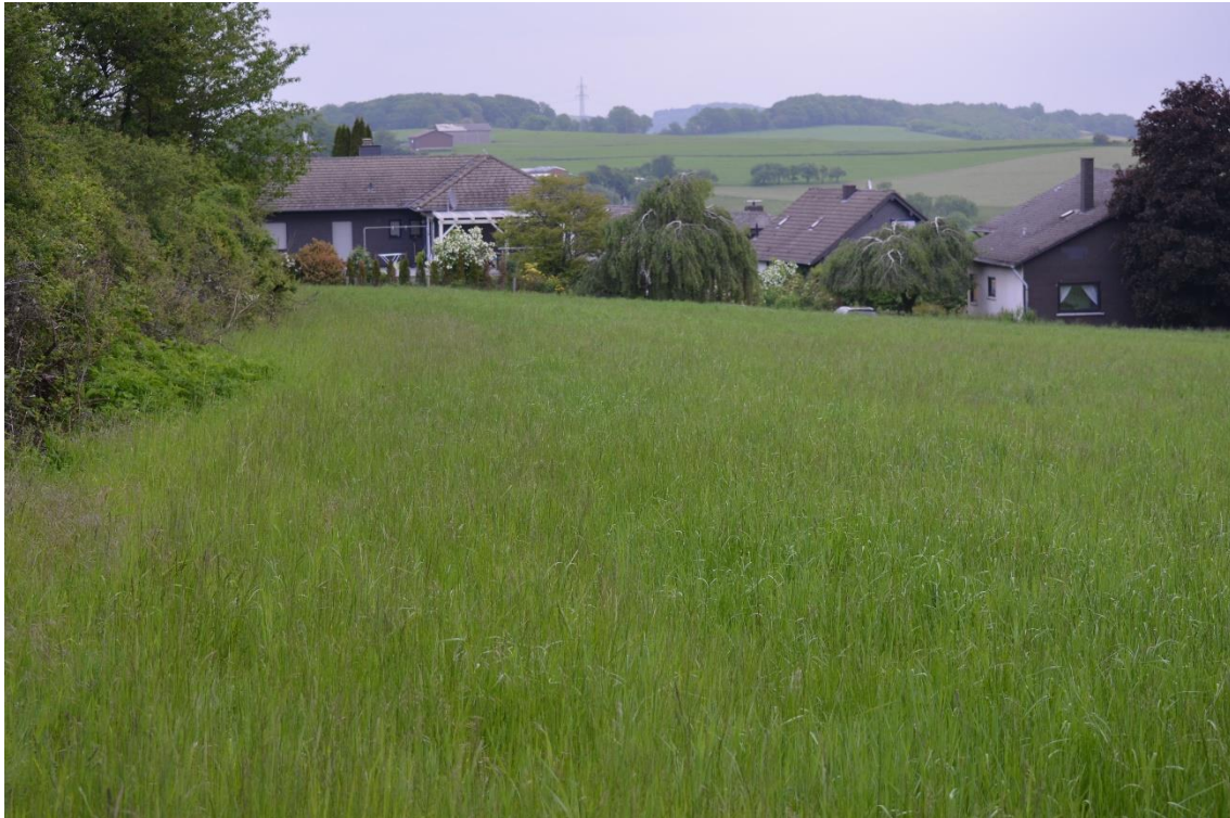
Abbildung 6: Plangebiet Blickrichtung Nordost Eigene Aufnahme vom 25.03.2023