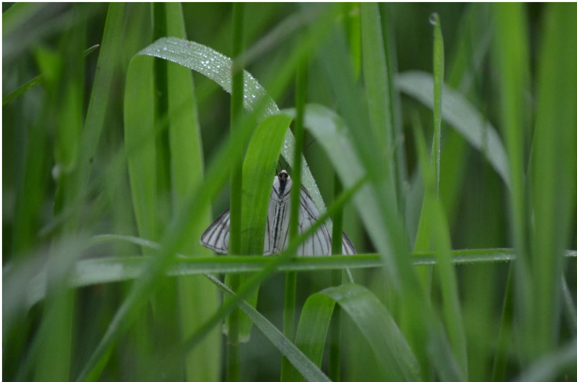
Abbildung 7: Hartheu-Spanner in der Offenlandschaft Eigene Aufnahme vom 25.03.2023