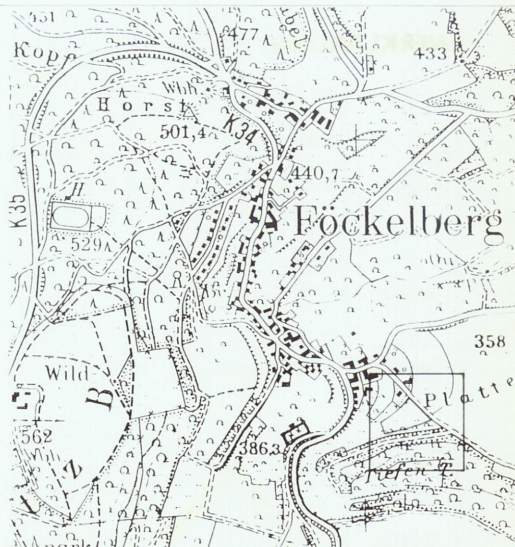
ÜBERSICHTSPLAN M 1:10000